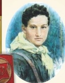
КОСМОДЕМЬЯНСКАЯ Зоя Анатольевна (1923–1941)

Командир орудия, гвардии старший сержант. В сентябре 1943 г. при форсировании Днепра переправившись на захваченный врагом плацдарм, со своим расчетом вступил в бой подождав огнём наступление советской пехоты и уничтожив орудия и боеприпасы противника.