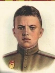
МАТРОСОВ Александр Матвеевич (1924–1943)

Военный лётчик, капитан, командир эскадрильи. Погиб 26 июня 1941 года совершая огненный таран: направил горящую машину на механизированную колонну врага.