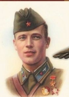
ТАЛАЛИХИН Виктор Васильевич (1918–1941)

Советский офицер, танковый ас. За два месяца 1941 г. уничтожил 52 танка противника, став самым результативным танкистом в Красной армии за всю историю Великой Отечественной войны. Погиб защищая Волоколамск.