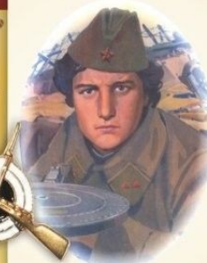
СТЕМПКОВСКАЯ Елена Константиновна (1921–1942)

Первая женщина, удостоенная звания Героя Советского Союза (посмертно), красноармеец диверсионно-разведывательной группы. В 1941 году была заброшена в немецкий тыл для выполнения задания по уничтожению врага, была схвачена, подвергалась жесточайшим пыткам и была казнена.