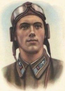
ГАСТЕЛЛО Николай Францевич (1907–1941)

Военный лётчик, капитан, командир эскадрильи. Погиб 26 июня 1941 года совершая огненный таран: направил горящую машину на механизированную колонну врага.