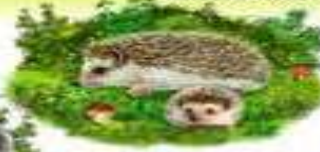
ЕЖ И ЕЖОНОК