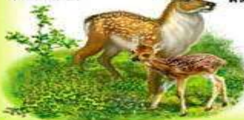
ОЛЕНЬ И ОЛЕНЕНОК