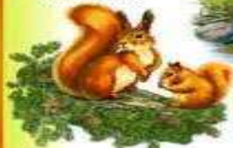
БЕЛКА И БЕЛЧОНОК