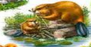
БОБР И БОБРОНОК