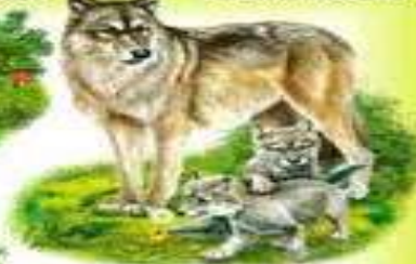
ВОЛК И ВОЛЧОНОК