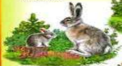
ЗАЯЦ И ЗАЙЧОНОК