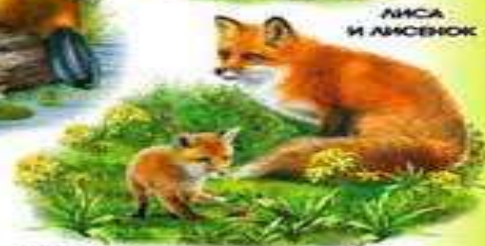
ЛИСА И ЛИСЕНОК